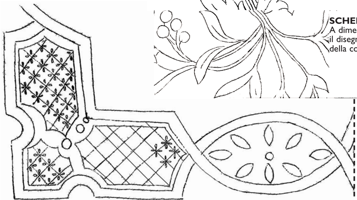
SCHEMA I A dimensione reale il disegno del fiore e della cornice