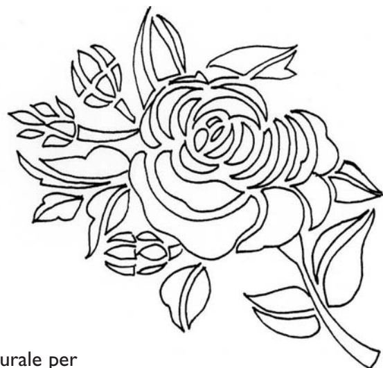
SCHEMA a grandezza naturale per l'asciugamano piccolo