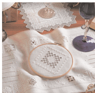
Imparaticcio bianco di pagina 52

VI DIAMO ALCUNI ELEMENTI BASE PER INIZIARE A CREARE LAVORI PERSONALIZZA- TI, STRUTTURATI SULLA TECNICA DEI FILI CONTATI CON I PUNTI: CORDONCINO, PIENO, PASSATO, QUADRO, RAMMENDO, SMERLO, ORLO A GIORNO; CON RITORTO FIORENTINO E TESSUTI DI LINO A TRAMA REGOLARE F.LLI GRAZIANO. INIZIAMO IN QUESTE PAGINE A SVELARVI ALCUNI SEGRETI