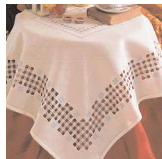
Tovaglietta Ecrù lavorata in azzurro di pagina 53

Tagliare un quadrato di stoffa di cm 38x38; dal centro contare 154 trame in alto e 2 a sinistra e fare tutti i quadretti di punto pieno seguendo lo schema. Ripetere 2° giro di quadretti a p. pieno a 12 trame dal 1° giro, fare i rombi sempre a p. pieno. sfilare tutto intorno con 4 trame tagliate e 4 trame lasciate. Punto smerlo di finitura.