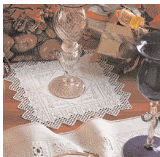
Centrino lavorato con grigio di pagina 53