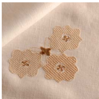
Motivo della striscia di pag.