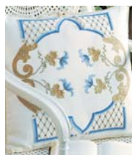
Cuscini di pagina 96-97

DALLA COLLABORAZIONE DELLA PIEMONTESE GIAVENO RICAMA CON LE ASSOCIAZIONI LIGURI DE FABULA E FILI DI LUNA DI SARZANA NASCE "IL RICAMO BANDERA INCONTRA IL RIPORTO GENOVESE", PROGETTO CHE UNISCE LE TRADIZIONI DI RICAMO DELLE DUE REGIONI