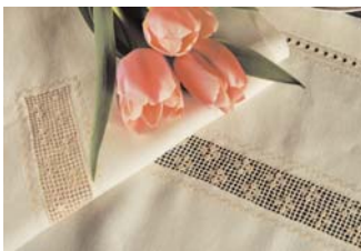
Striscia con sfilature di pagina 57

In alto e nella pagina precedente, lo schema a simboli su quadrettato per realizzare il drago in sfilato e i motivi di ornamento della striscia di pagina 55. Nb i quadretti con il simbolo sono la rete.