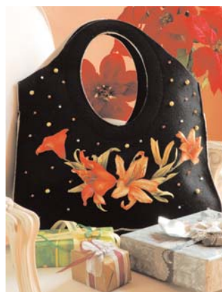
La Borsa con i fiori a rilievo e perline