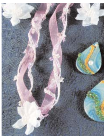
Set di organza rosa con i fiorellini