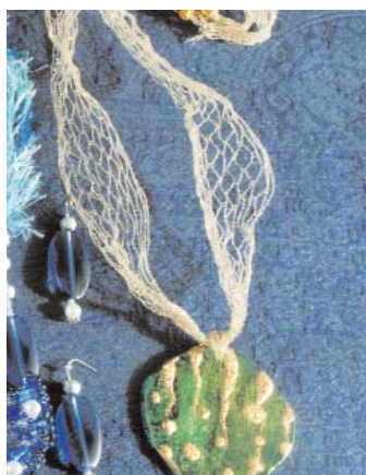
Modello n.5- Collana Charm

E' un modello di leggerezza dato dalla organza. E' molto veloce da fare. Con una colla a presa rapida incollare un fiorellino di organza bianco sulla clip. Unire i due nastri di organza, applicare poca colla sulle estremità per unirli e ricoprire ambedue i lati con la chiusura metallica. Avvolgere leggermente il nastro e nella parte centrale posizionare il terzo fiorellino con la clip.