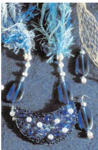
Un set Chic tonalita' bianco blu'