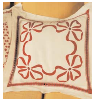
Cuscino con ricamo rosso di pagina 73