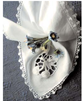
Fazzoletto con l'angolo con le ciliegie di pagina 42

Il fondo consiste sempre in giri di andata e ritorno riempiendo cosi gli spazi vuoti e unendosi al buchino o ai fiori con un magli a bassissima; partendo da un angolo del triangolo fare un m.bassa 3 cat. un pippolino di 3 catenelle 3 catenelle e con un m. bassissima unirsi ai fiori o al buchino. Continuare cosi ( sembra quasi un zig zag), dove lo spazio è più grande formeremo delle stelle a 6 /5 /3 punte; 1m. b.3 cat. un pippolino 7 catenelle 1 pippolino e 3 catenelle 1m.bassa; nel giro di ritorno 3cat. 1 pippolino 3 cat. puntare al centro delle sette cat. e cosi via fino a riempire gli spazi.