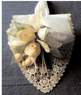
Fazzolettino con angolo in Merletto d'Orvieto di pagina 42