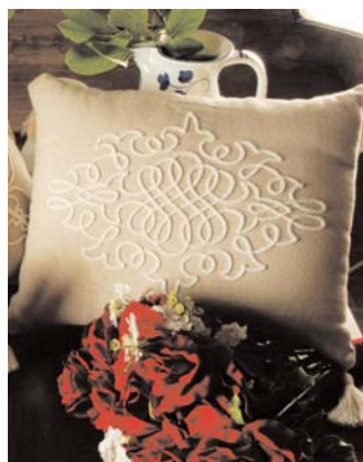
Cuscino di pagina 36

ESEMPLARI DI RICAMO A TRECCIA APPLICATO AGLI OGGETTI QUOTIDIANI, A TESTIMO- NIANZA DI UNA TECNICA AFFASCINAN- TE CHE SA ESSERE ANCORA ATTUALE: LA TRECCIA DI SAVIGNANO RICAMATA CON FILO LINEN COATS CUCIRINI SU TELA SIENA F.LLI GRA- ZIANO